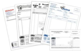
Ordenamiento y etiquetado de documentos