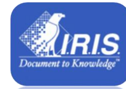
Proceso de Indexación Por OCR