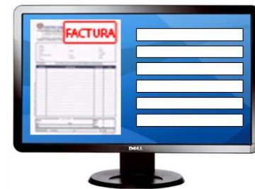
Validación y verificación de Índices