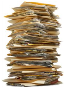
Preparación de documentos