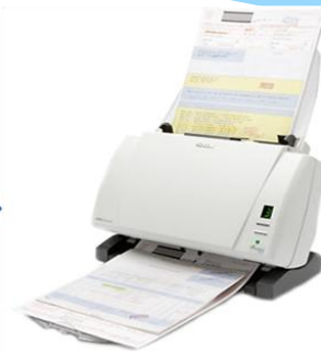
Digitalización de documentos