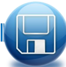
Componente de Carga al Sistema Documental